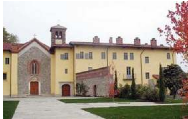
La Certosa del Gruppo Abele dove ci si trova per riflettere

Si parla di dipendenze e si pensa subito alla droga e all'alcool: invece sono sempre più insidiose e molteplici le «dipendenze» che possono caratterizzare la nostra vita, come il cibo, le mode, la televisione, la casa, il lavoro, un affetto. Dipendenze che in alcuni casi diventano vere e proprie patologie ma che - in ogni caso - significano la perdita di autonomia da parte dell'individuo di fare scelte autonome. E proprio del «Limite e libertà assoluta tra vecchie e nuove dipendenze» si parla sabato 28 gennaio nell'incontro mensile che si terrà alla Certosa - Gruppo Abele di via Sacra di san Michele 52 ad Avigliana. Nel 2011 gli italiani hanno speso 73 miliardi in gioco di azzardo, circa 1500 euro per ogni maggiorenne italiano, 800 mila le persone dipendenti. Anche il cibo - nello stramangiare (bulimia) o nel suo rifiuto - sottolineano forme di dipendenza, ma alcune di queste più